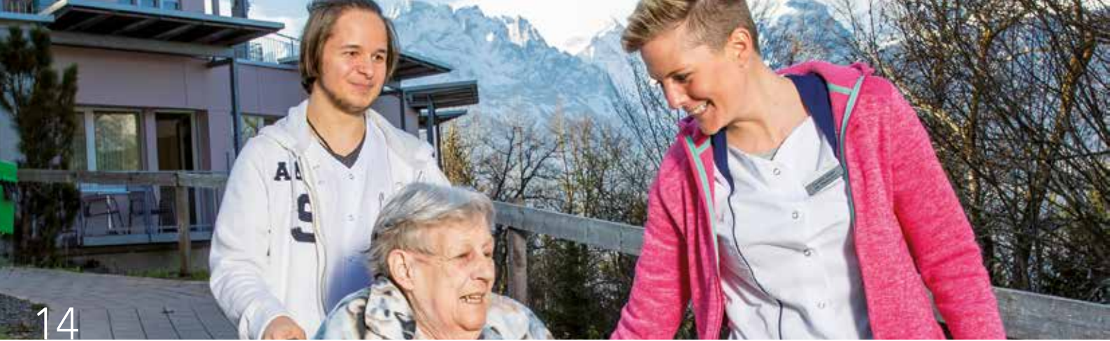
Attraktive Lehrstellen bei der Michel Gruppe.