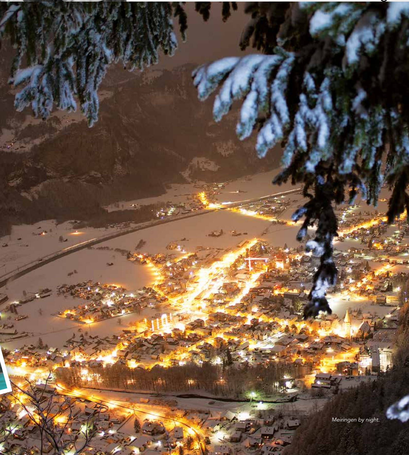
Meiringen by night.