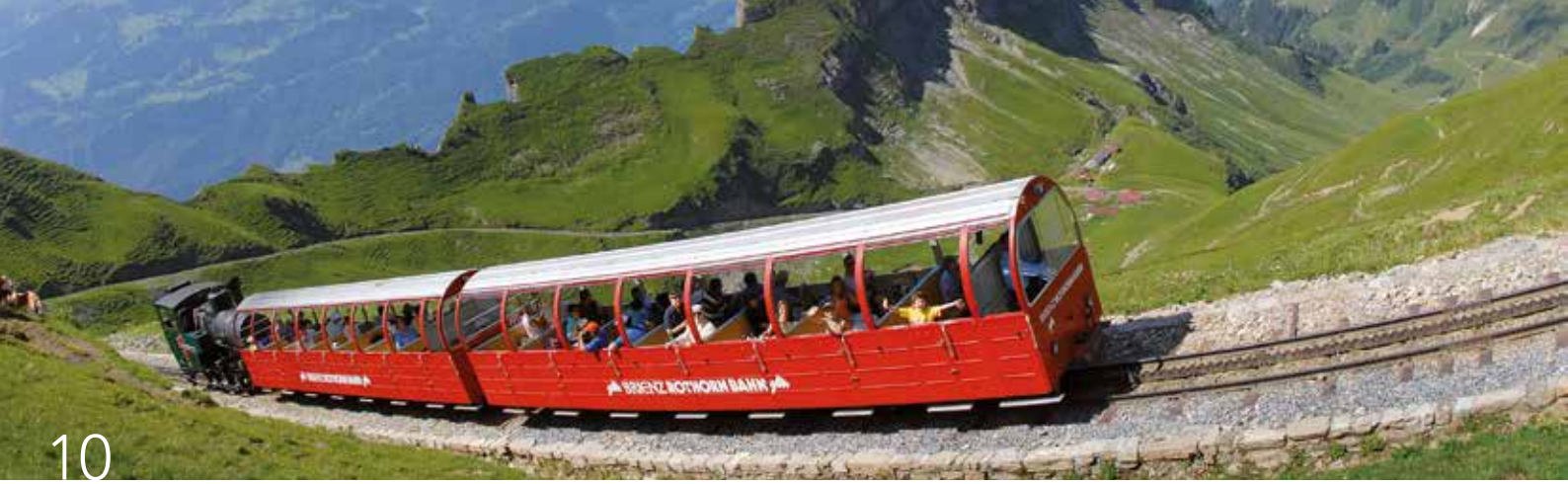
Brienz Rothorn Bahn – älteste Dampfzahnradbahn der Schweiz.