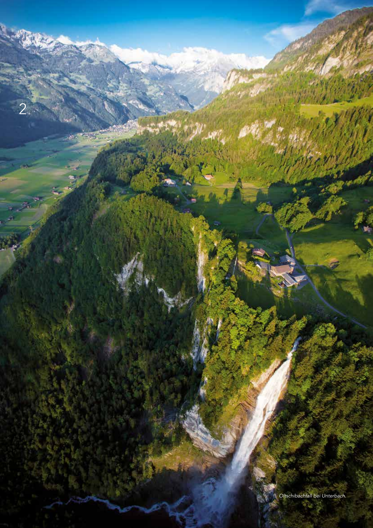
Oltschibachfall bei Unterbach.