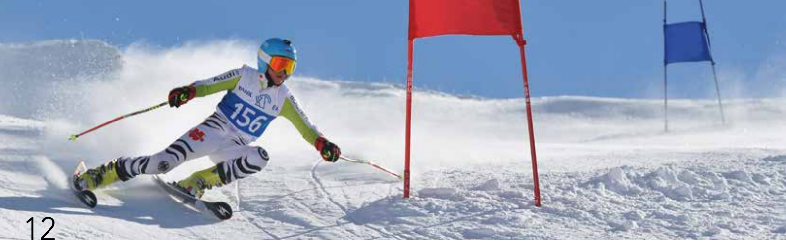
Skirennen im Skirennzentrum Hasliberg.