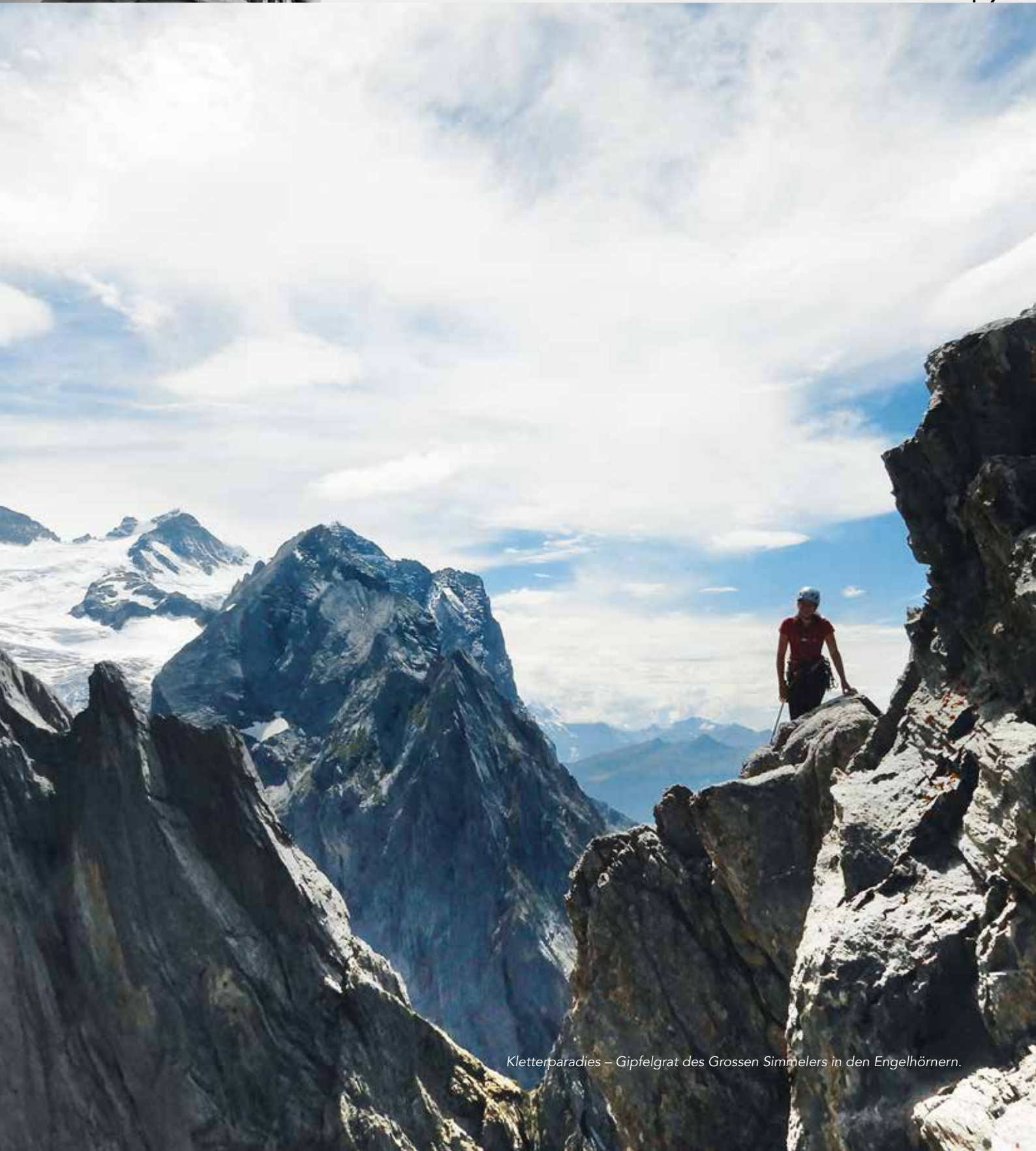
Kletterparadies – Gipfelgrat des Grossen Simmelers in den Engelhörnern.