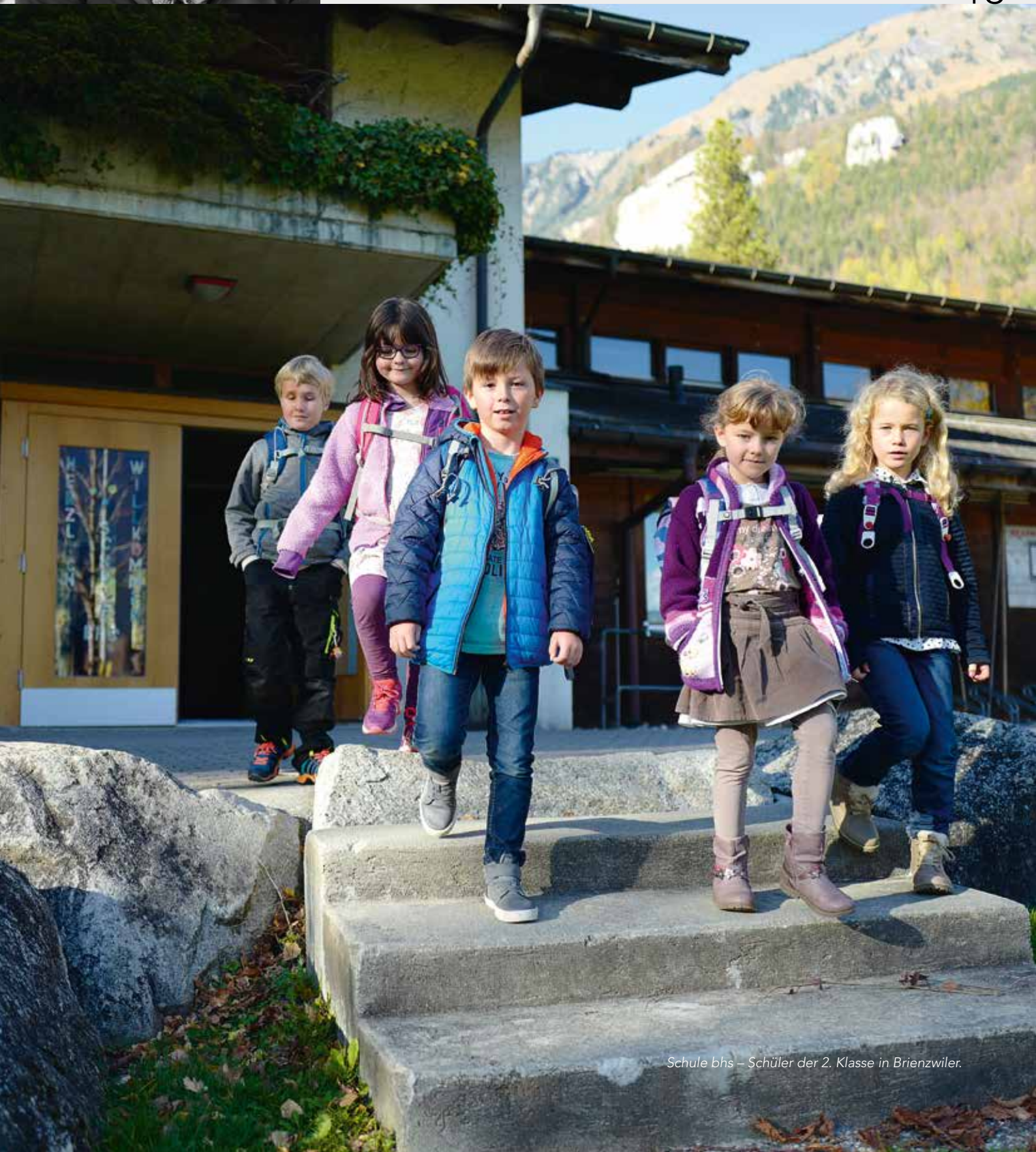
Schule bhs – Schüler der 2. Klasse in Brienzwiler.