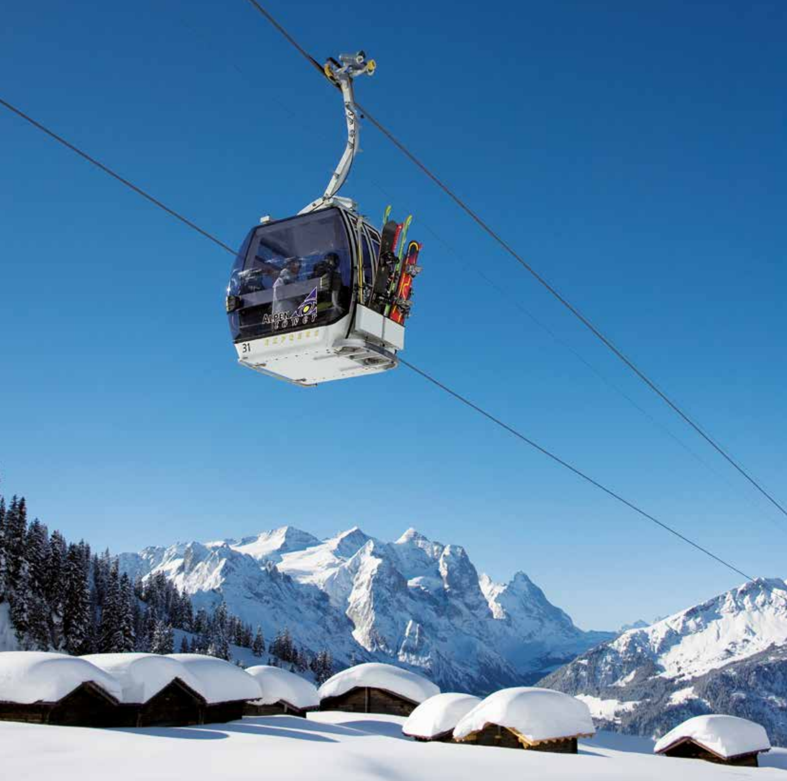
Wintersport am Hasliberg mit beeindruckendem Panorama – Rosenhorn, Mittelhorn, Wetterhorn, Mönch und Eiger.