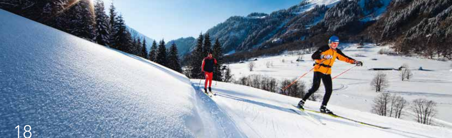
Langlaufen in Gadmen.