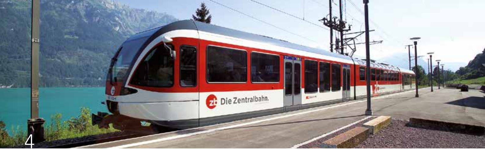
Optimale ÖV-Anbindung an die Städte Interlaken und Luzern.