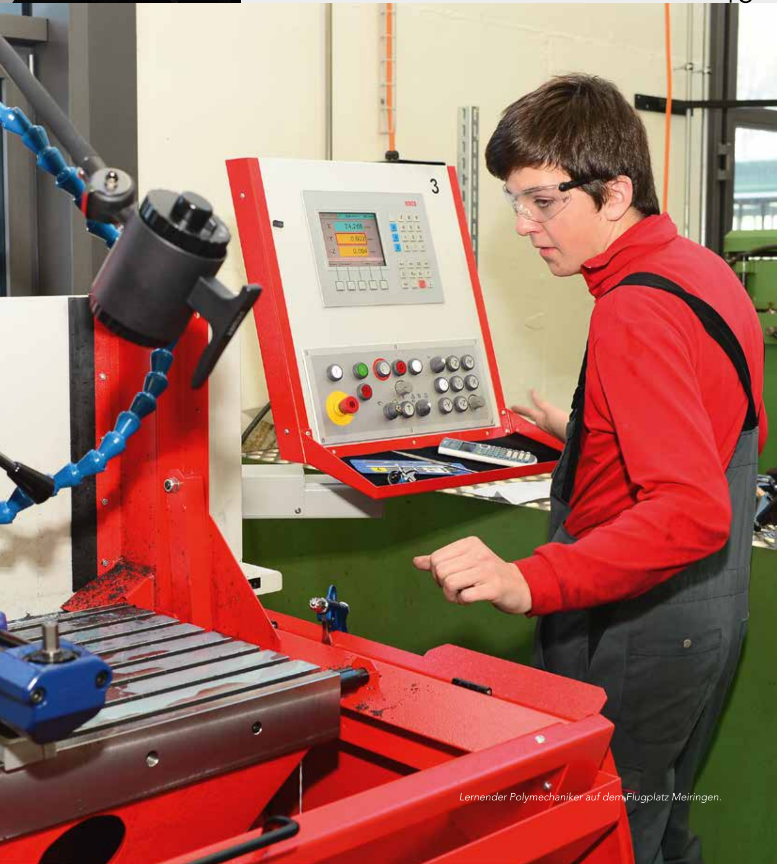
Lernender Polymechniker auf dem Flugplatz Meiringen.